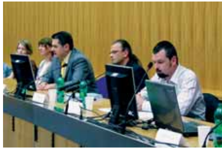
Představení konceptu probíhalo i formou několika veřejných besed.