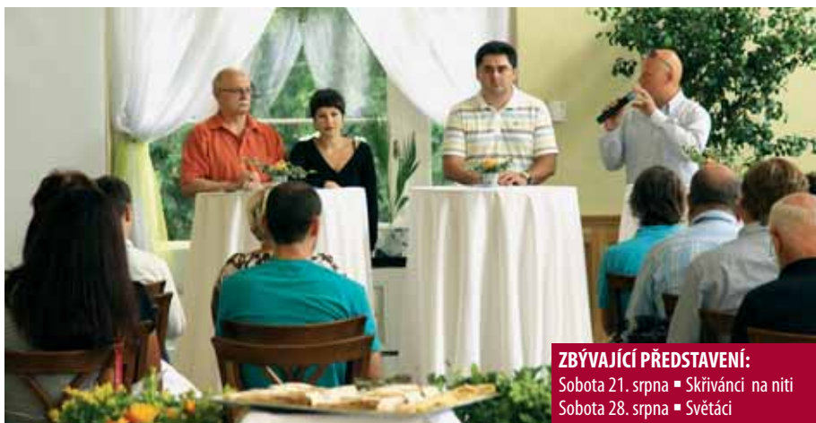
Primátor Martin Novotný (druhý zprava) na tiskové konferenci při zahájení kampaně na pomoc Kinu Metropol.

„Metropol sice každoročně získává od města dotaci ve výši téměř sedm set tisíc korun, ale ta sotva pokrývá provozní náklady. Kino přitom bude v horizontu jednoho až tří let stát před potřebou kompletního přechodu na digitální technologii.