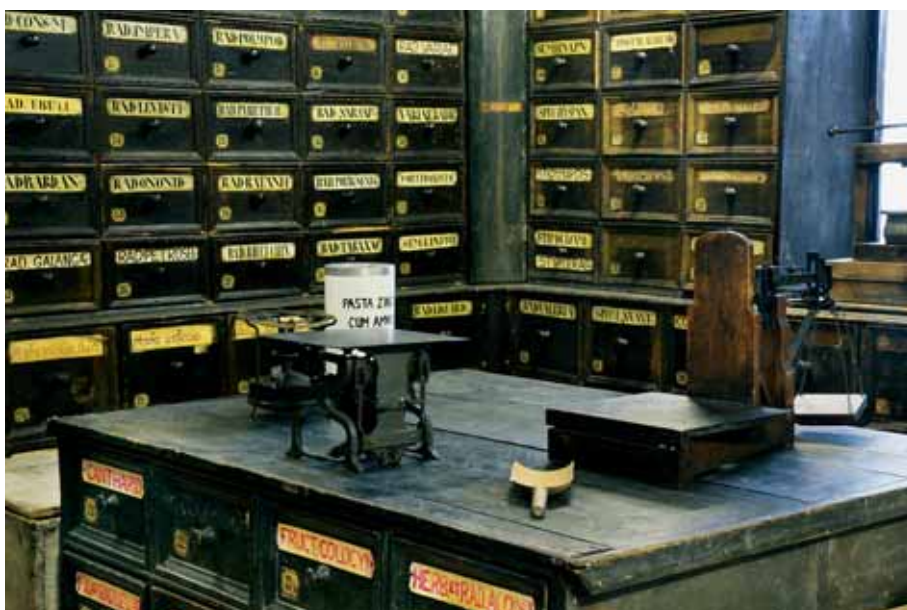
Barokní herbárium z Krajinské lékárny je svou dochovalostí v českých zemích raritou.

Nejbohatší historii z olomouckých lékáren má Krajinská lékárna. V původně kupeckém a řemeslnickém domě byla lékárna otevřena již v roce 1571. V polovině 18. století prošel dům rekonstrukcí. A právě z této doby, kdy byl ve vlastnictví lékárníka Ignáce Zaudiela a následně Josefa Dismase Schröttera, pochází unikátní herbárium. „Herbárium sloužilo k uskladnění bylin, které lékárníci sušili na půdách nebo v podkroví lékáren. Tato část lékárny nebyla veřejně přístupná, proto i vybavení bývalo velmi strohé. Doporučovalo se zde mít pohodlné dlouhé šuplíky pro uskladnění rostlin a dodržovat abecední pořádek při jejich řazení. To se týká i herbária z Krajinské lékárny, které bylo vytvořeno na míru pro jednu z podkrovních místností ve třetím patře,“ popsal Hradil exponát, jehož šuplíkové regály dosahují výšky dvou metrů a na půdorysu písmene „U“ délky úctyhodných 15 metrů. Olomoucké herbárium je přitom u nás jediné, které se z doby baroka dochovalo kompletní. Vzhledem k rozměrům museli dokonce odborníci při stěhování herbária rozdělit a v muzeu znovu složit.