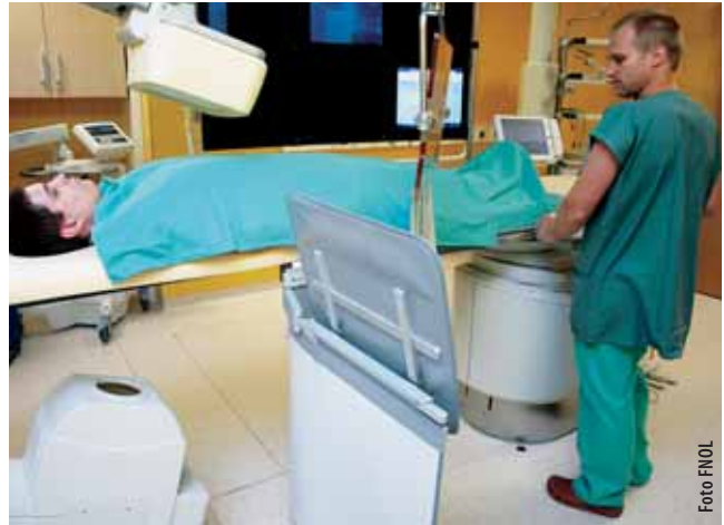
Figurant simuluje využití nové angiolkou kombinující výhody operačního sálu s rentgenologickou vyšetřovnou.

Kardiologickou péči o pacienty se srdečními a cévními chorobami zajišťuje ve FNOL pracoviště I. interní kliniky. Pro diagnostiku a intervenční výkony měla klinika doposud k dispozici jednu angiolkou. „Po vybudování nového elektrofyziologického sálu s druhou angiolkou jsme nyní schopni nabídnout pacientům v rutinním provozu širší spektrum výkonů a díky moderním technologiím ještě kvalitnější péči. Posunuli jsme se mezi pět nejmodernějších pracovišť v České republice v oblasti intervenční kardiologie a léčby poruch srdečního rytmu,“ prohlásil docent Miloš Táborský, přednosta I. interní