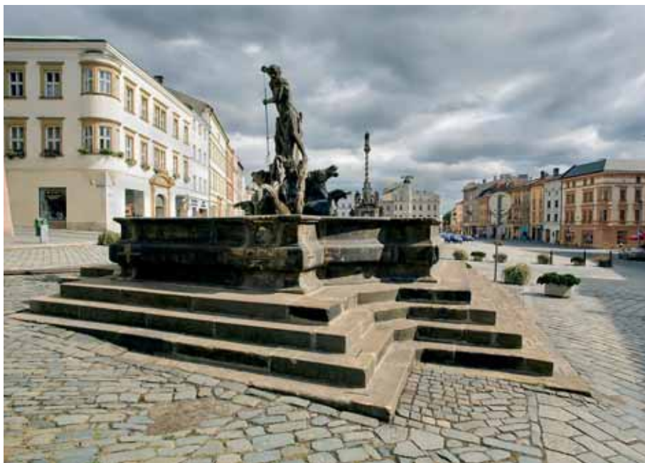
Jedna se šesti kašen s antickými náměty, Neptunova kašna na Dolním náměstí.