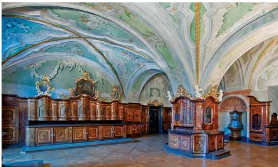
Sakristie kostela Panny Marie Sněžné.