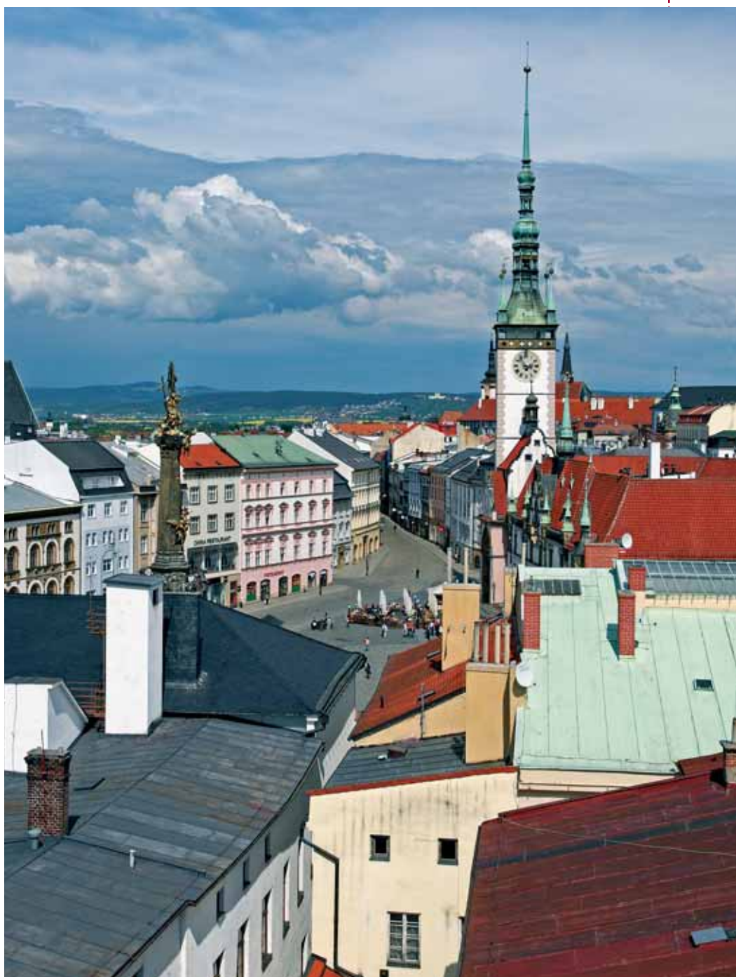
Celkovou tvář Olomouce baroko poznamenalo zcela zásadně.