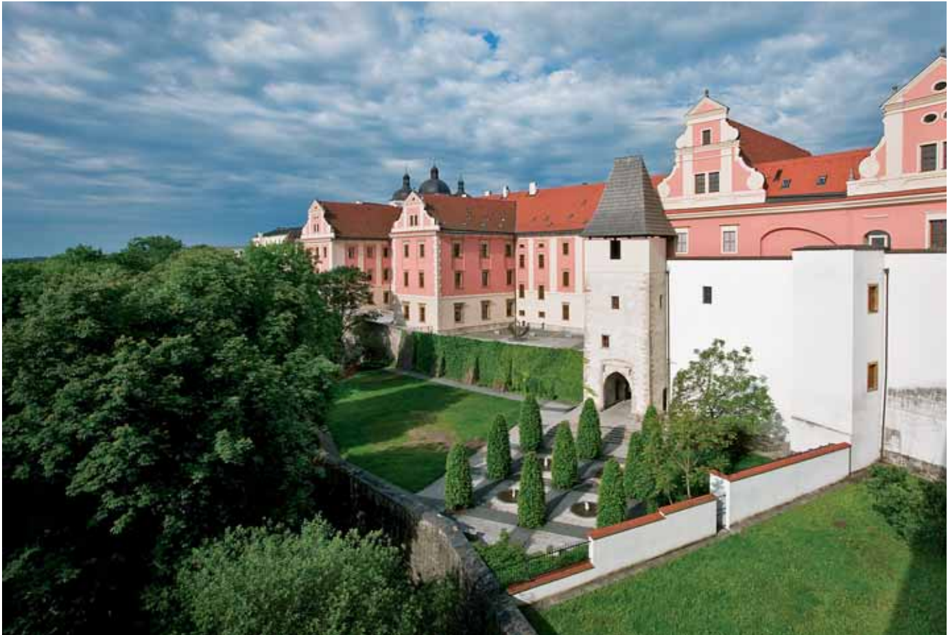
Rozsáhlý komplex jezuitského konviktu slouží i po staletích studentům.